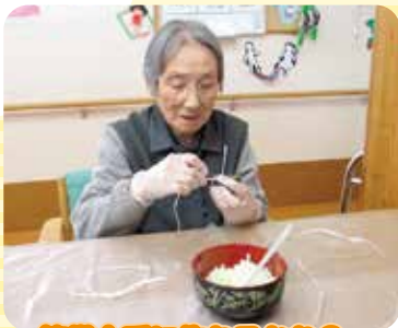
笹巻上手に作れるかな?