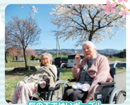
桜の下ではいポーズ！