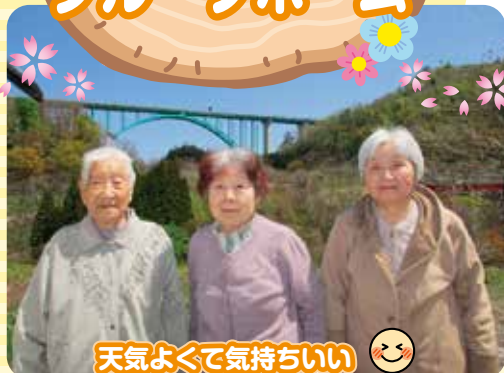
天気よくて気持ちいい 花見ドライブ、月山ダムまで行ってきたよ!!