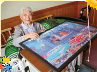
1000ピースのパズルもうすぐ完成