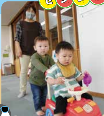
ドライブに出発～!! 行くよ～!!