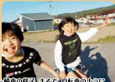
一輪車の様子。まるで、自転車のように 両手でバランスをとりながら乗っています。