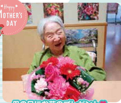
母の日にお花のプレゼント♡