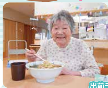
出前ラーメンおいしいの～