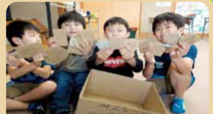
オリジナルめんどろを作り、めんどろ対決をする3年生。 いろんなキャラクターを描いて楽しんでいます。