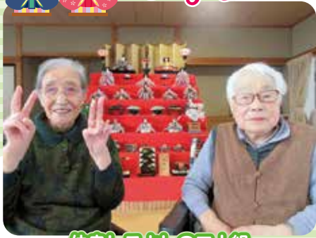
仲良しこよしの三人組