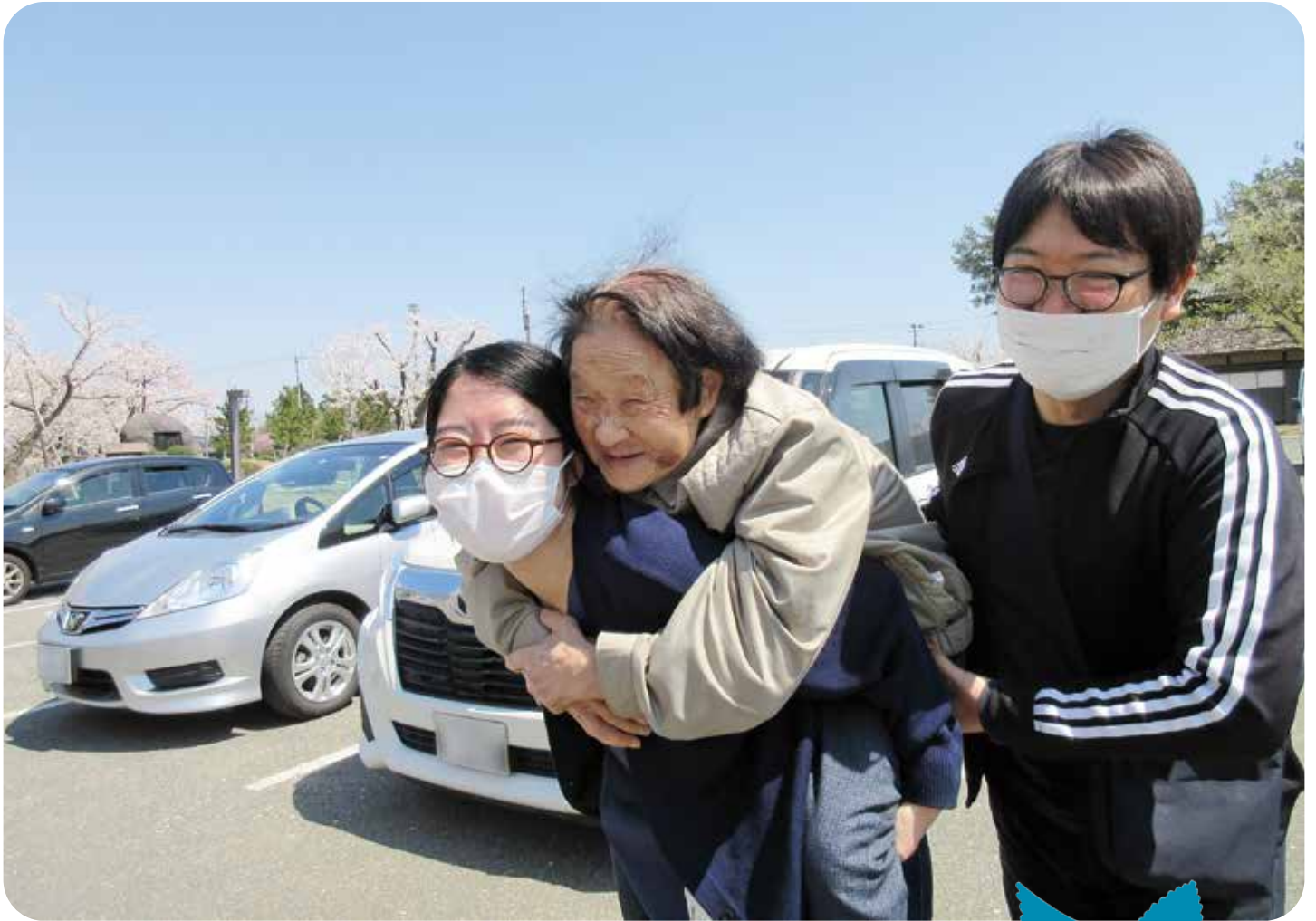
かたくり荘でお花見ドライブに出かけた時のワンシーンです。