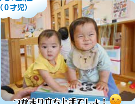
つかまり立ち上手でしょ！😊