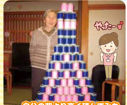
自分の背より高く積んでみた