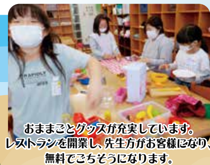
おままとグッズが充実しています。 レストランを開業し、先生方がお客様になり、 無料でごちそうになります。