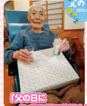
「父の日に ノンアルコールで乾杯!!」