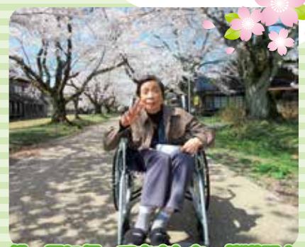
松ヶ岡に行ってきました。桜満開！